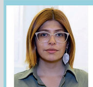
Paloma Zúñiga Consejera Constitucional, RD

“Mi desesperanza es que (el proceso) no se va a resolver como yo esperaba se resolviera. Es decir, con un verdadero consenso, con una maciza y mayoritaria votación, de manera que reemplazáramos una constitución cuyo principal problema no es el texto, sino que el contexto, es decir, la falta de credibilidad en ella”.